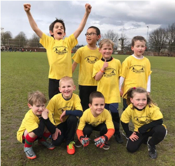
Groep 3/4B in actie

Vorige week heeft een aantal kinderen van onze groep mee gedaan met het schoolvoetbaltoernooi. Ondanks dat het weer niet steeds mee zat, hebben ze hard gestreden. Echte doorbijters. Winst zat er niet in. Maar meedoen is belangrijker dan winnen. Wij zijn trots op jullie!